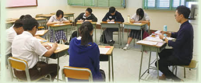
學生積極準備口語題目-英文組