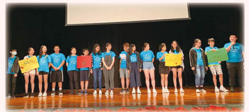
同學於結業典禮上以英文匯報學習成果