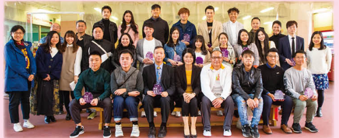
陳校長與老師及校友合照