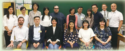
英文科聯校口語訓練-大合照