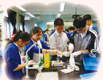
學生齊心合力完成活動