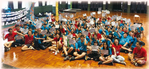
各位充當小老師的同學大合照