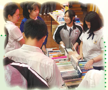
書展售書繁多，目不暇給，同學們都就心頭好交流意見