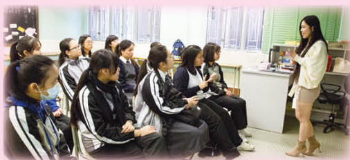
任職各行各業的校友回校向同學介紹其職業範疇

為了讓學生對未來作好準備，本校升學及就業輔導組於2019年12月13日舉辦了「生涯規劃日」，邀請了舊生及嘉賓到校分享工作經驗及介紹不同行業的入行門檻，如公司董事、護士、網絡安全顧問、化妝師、空中服務員等，藉此讓學生認識不同行業及其入職要求。學生對此活動反應十分正面，認為活動能讓自己對心儀行業有更深入的了解，明白不同行業的實際情況。