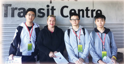
meeting the host family