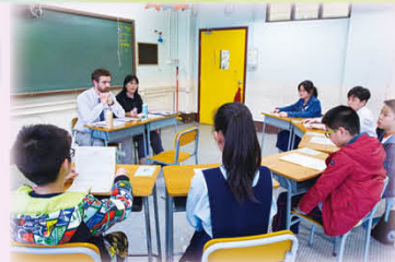
升中模擬面試工作坊反應非常熱烈

當日亦是本校的開放日，近千人到臨參與開放日攤位遊戲，包括學科遊戲如科學科的空氣炮、電流急急棒等，氣氛高漲。開放日更設有美甲攤位及有美味小食供應，來賓更可憑遊戲蓋印換取禮物，當中更有甚受歡迎的幸運夾公仔機。