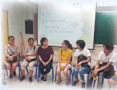
家長分享親子教養之道