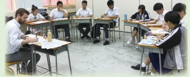
外籍老師擔任口語主考官