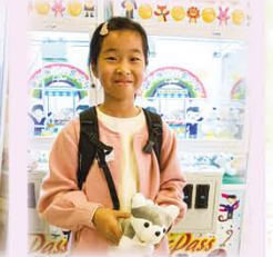
同學幸運地夾到毛公仔，非常興奮