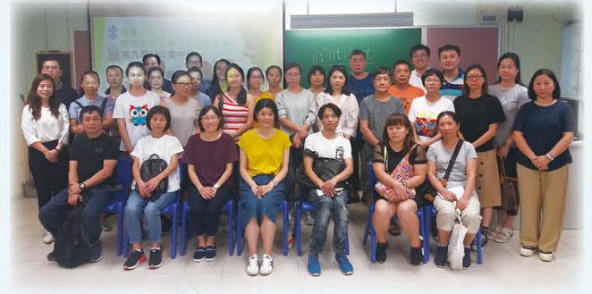
「青少年打機成癮」家長講座大合照