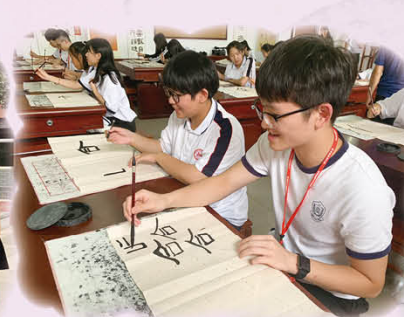
在姊妹學校我們學習書法，寫下「和、合」二字，寓意深遠