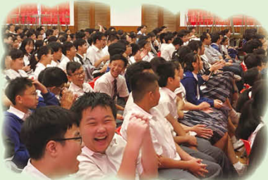
話劇內容幽默非常，全場同學笑得合不攏嘴，大呼精彩

中文科圍繞「重陽」主題舉辦了中文週，豐富活動包括書展、聽書茶室、毛筆揮毫書法攤位、文化詩詞大賽、普通話話劇表演等，深受同學歡迎。透過踴躍參與一系列富有書卷氣息的活動，同學除了能夠增潤課堂知識，更可深入認識源遠流長的中華傳統節日，培養對歷史文化的興趣。