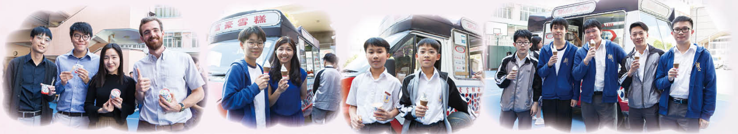
陳校長為老師及同學送上雪糕，發放正能量

早前教育局宣布全港學校停課數天，復課後，學校特意於午膳時間，安排了雪糕車到校，為全校師生及員工送上雪糕。學校希望為各人打氣，希望大家都能積極迎接未來的挑戰。