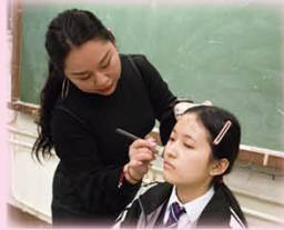
任職化妝師的校友即席為同學化妝