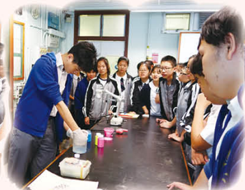
學生示範魔法沙的特性