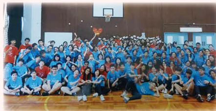
「夏橋計劃」紫組大合照