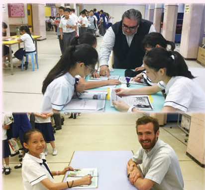
外籍老師耐心教導學生發音