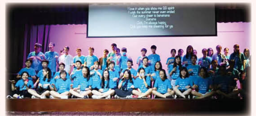
「夏橋計劃」結業禮大合唱，大家都依依不捨