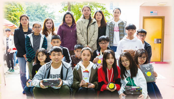
一眾家教會家長委員與獲得聖誕抽獎禮物的同學合照