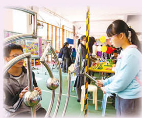
來賓投入參與開放日攤位遊戲