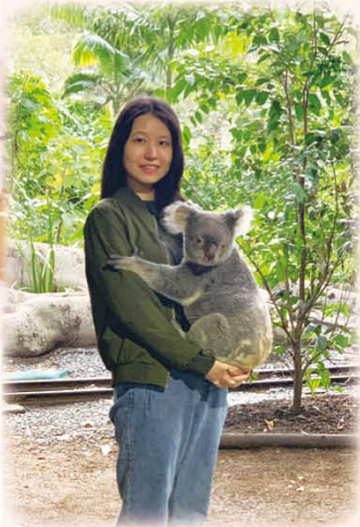
cuddling a koala at Currumbin Wildlife