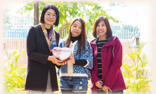
一眾家教會家長委員為答謝陳校長一直以來對學校及學生的努力，特意贈送小心意予陳校長