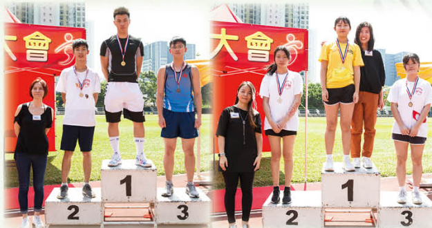
家委與得獎者留影