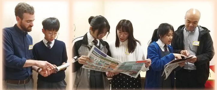
外籍老師鼓勵同學活用英語交談