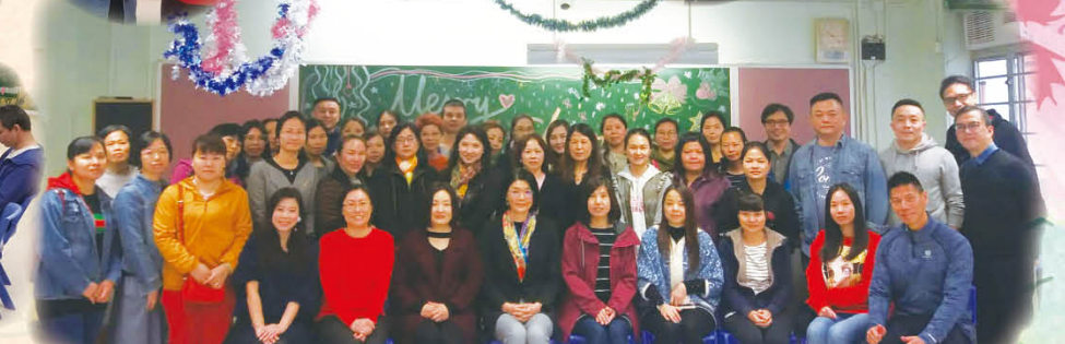
聖誕家長茶聚大合照