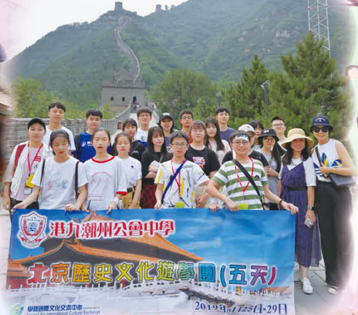
「不到長城非好漢」以後請叫我們「好漢」