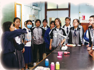
老師在講解魔法沙活動的目的

本校於2019年11月12日於午膳期間舉行了一個有趣的「魔法沙」工作坊。在工作坊中，同學除了可感受「魔法沙」沾水不濕和不易鬆散的神奇魔法外，更可親自製作魔法動力沙，十分奇妙。在活動中，同學不但可在輕鬆的氣氛下體驗科學世界之奧妙，更可學習不少化學知識呢！