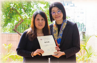
陳校長頒發委任狀予新一屆的家長委員