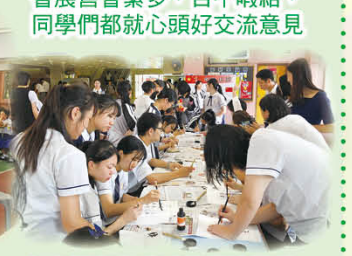
在老師和小助手的書法攤位，各個年級的同學都執起毛筆，細心練字