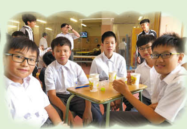
茶室裡，五位展露笑顏的嗜茶少年，續杯數次，只為以茶會友