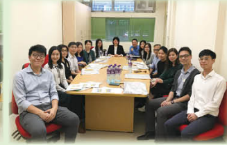
中文科聯校口語訓練-大合照