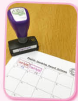
英文朗讀計劃印章

中一、二級同學須於午膳時間，朗讀指定英文篇章，良好表現者獲印章乙個，儲齊五個印章更會獲贈神秘禮物，藉此鼓勵同學勇於以英語與人溝通及增加他們對學習英文的興趣。