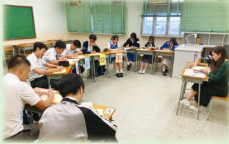
學生積極準備口語題目-中文組