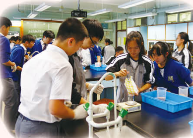
學生動手動腦鑽研魔法沙的奧秘