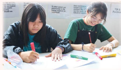
同學以自己擅長的技能及知識，充當小老師來教導其他同學，教學相長