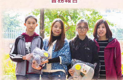
家教會家長委員頒獎予同學