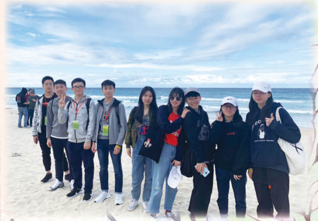
excursion at Surfers Paradise