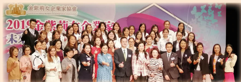
2019金紫荊女企業家「未來領袖獎學金及培訓計劃」得獎者大合照