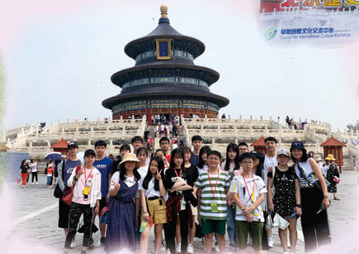
遊歷北京的名勝古蹟讓我們更好地認識歷史文化