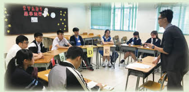
學生聆聽評審老師的回饋

本校中、英文科與 8 間友校舉行「中六聯校模擬口語訓練」，並由本校及友校老師擔任口語主考官，即場為參與同學進行評核和給予口頭回饋，讓學生知己知彼，並獲取更多實戰經驗。