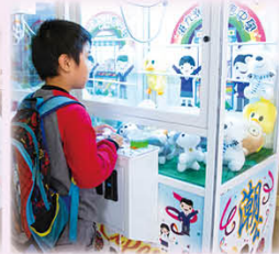
同學全神貫注地玩夾公仔