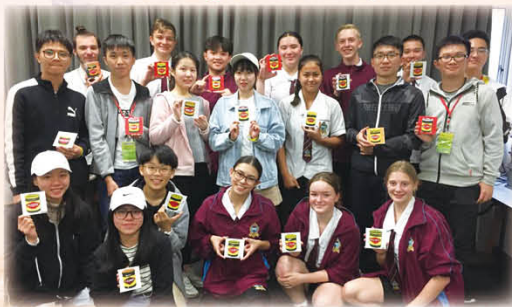
visit at a local school