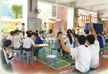
聽過老師的書籍分享，在場同學深有共鳴，紛紛舉手發問