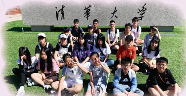
我們來到傳說中的清華大學