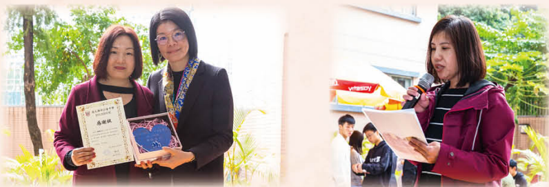
陳校長頒發感謝狀及紀念品予前任的家長委員

在聖誕這個普天同慶的日子，除了聖誕聯歡會外，當日還舉行了家教會就職典禮暨會員大會。除頒發委任狀予新一屆的家長委員，亦頒發感謝狀予前任的家長委員，感謝她們在過去對學校的付出及支持。