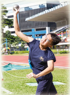
運動員出盡全力，渾身解數去比賽