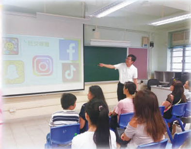
丁社工介紹青少年常用的社交媒體