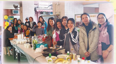
一眾家長義工為學校開放日開設美甲及小食攤位