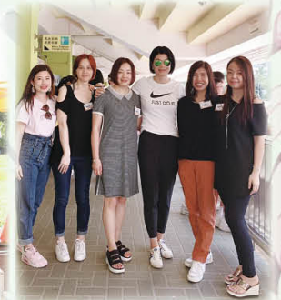
陳校長與家委開心大合照