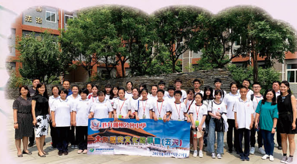
探訪北京平谷第四中學，感受北京當地的中學生學習模式，獲益良多

本校於2019年6月25至29日展開了「北京文化歷史遊學團」，並前往姊妹學校北京市平谷區第四中學進行交流。師生們在這5天4夜的交流中遊覽了北京著名歷史景點，如王府井大街、故宮、長城、水立方、頤和園等等。除了對北京歷史古蹟有所認識，更對北京市民實際生活有了親身體驗。