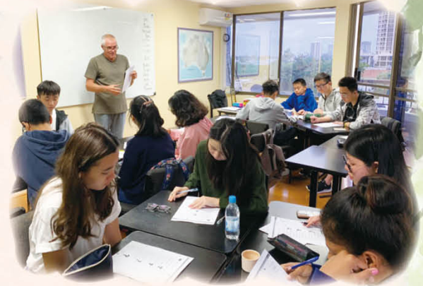
English lessons at a local language school

A 10-day Australia Study Tour organized by the English Department between 22nd June to 1st July 2019 provides students with a very unique and valuable opportunity to explore Gold Coast in Australia. The English lessons in the language school, the visit to a local high school, excursions to the city's renowned scenic spots and, most importantly, the stay with host families offer students a one-in-a-lifetime experience to immerse themselves in a different country, an authentic learning environment. Students had a pleasant and rewarding time and have definitely gained a lot from this invaluable overseas study tour.